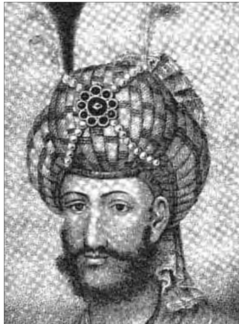
طرحی از چهره شاه تهماسب صفوی