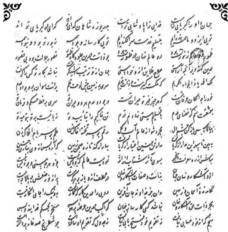
تصویر شماره ۱: از نسخه کتابخانه آستان قدس رضوی